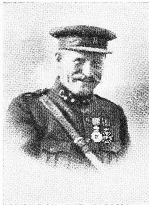
FALLY, Eugène, né le 17 avril 1873, à Quiévrain. Major. Offic. O. de Léop; Offic. O. de la Couronne; Croix de Guerre. Tomba mortellement blessé en commandant, sous un violent feu ennemi, le tir de sa batterie à cheval, à Pervyze, le 14 septembre 1917; succomba, le même jour, à l'ambulance "l'Océan", à La Panne.