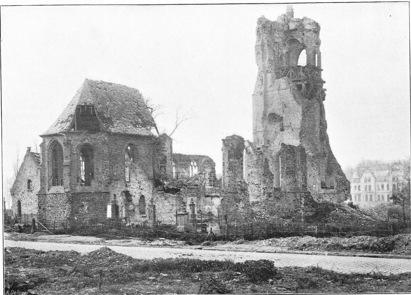
L'Église d'Elverdinghe et la route d'Ypres.